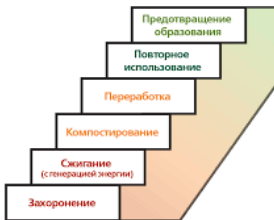
Рис. 1. Лестница Лансинка

Данную технологическую иерархию предложил в 1979 году Ад Лансинк, который был в составе голландского правительства. Разработанная им иерархия приоритетных методов по обращению с ТКО со временем была включена в Директиву ЕС «Об отходах» (Directive 2008/98/EC on waste) в качестве основополагающей иерархии по обращению с отходами.